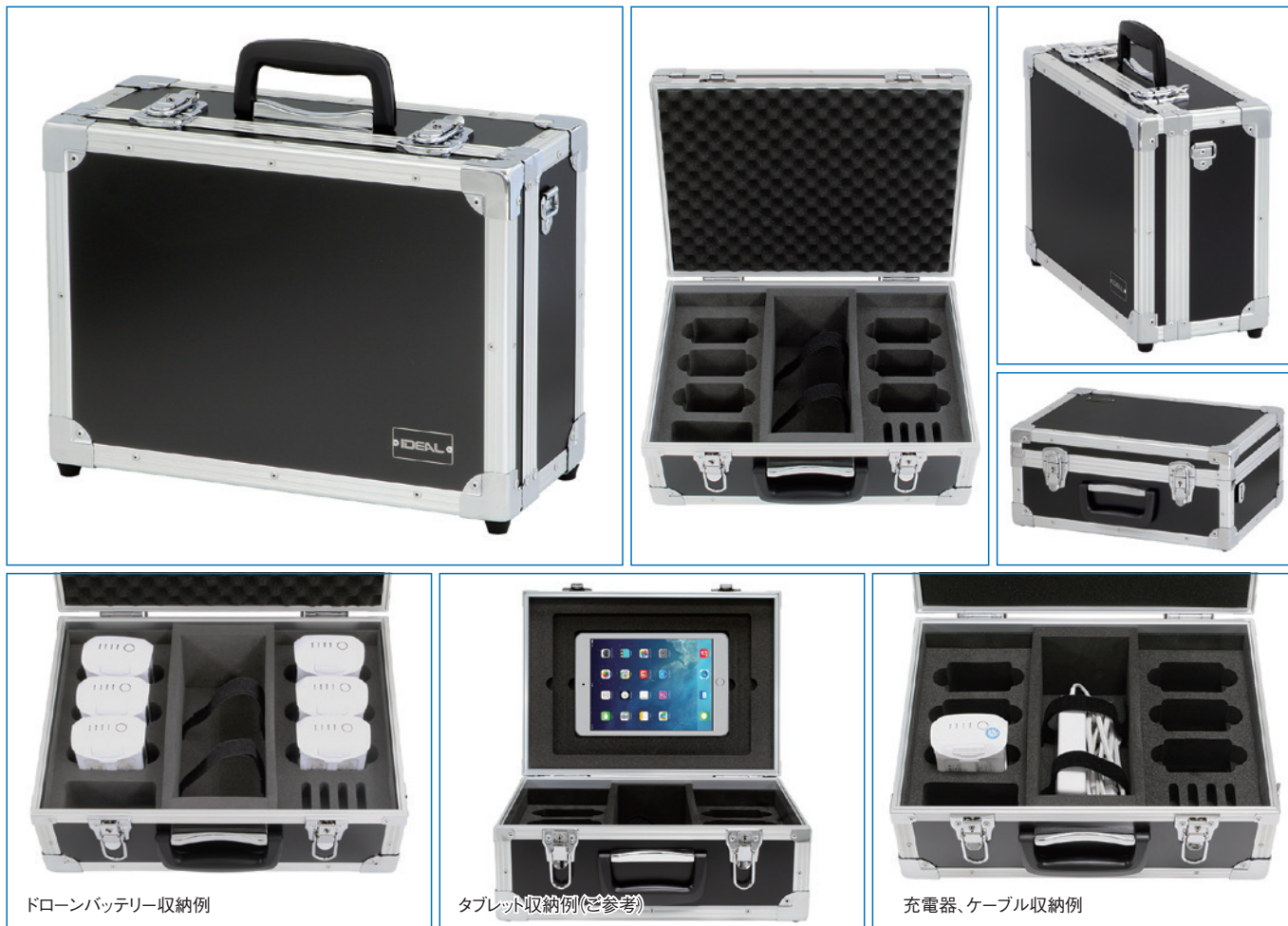
ドローンバッテリー収納例