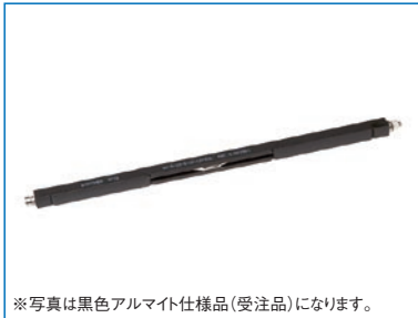
※写真は黒色アルマイト仕様品(受注品)になります。