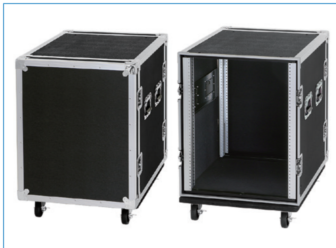
19インチマウント部(アルミフレーム)