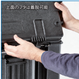
上面のフタは着脱可能