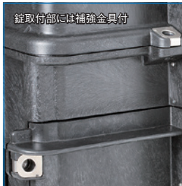
錠取付部には補強金具付