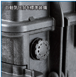
自動気圧弁を標準装備