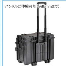
ハンドルは伸縮可能 (990mmまで)