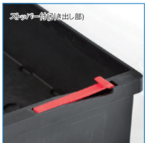
ストッパー付(引き出し部)