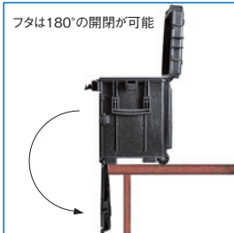
フタは180°の開閉が可能