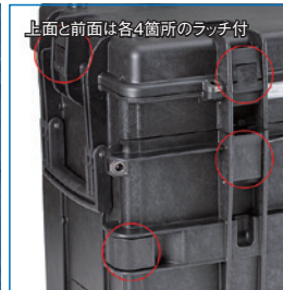
上面と前面は各4箇所のラッチ付