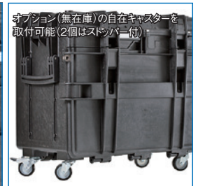
オプション (無在庫) の自在キャスターを 取付可能 (2個はストッパー付)