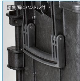
両側面にハンドル付