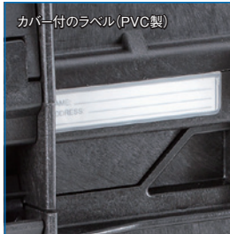
カバー付のラベル (PVC製)