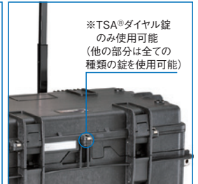
※TSA®ダイヤル錠 のみ使用可能 (他の部分は全ての 種類の錠を使用可能)