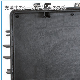
充填式のシーリング (上面のフタ)