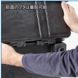
前面のフタは着脱可能