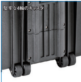
堅牢な4輪のキャスター