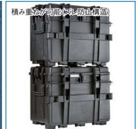
積み重ねが可能 (スレ防止構造)