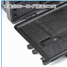
充填式のシーリング (前面のフタ)