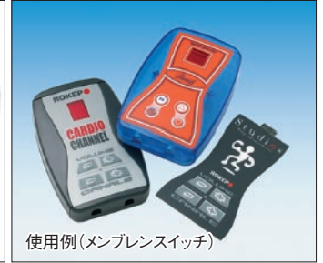
使用例(メンブレンスイッチ)