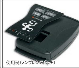
使用例(メンブレンスイッチ)