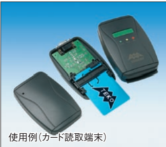
使用例(カード読取端末)