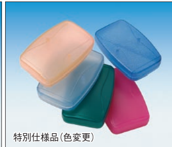
特別仕様品(色変更)