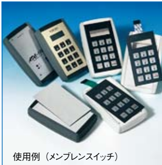
使用例 (メンブレンスイッチ)