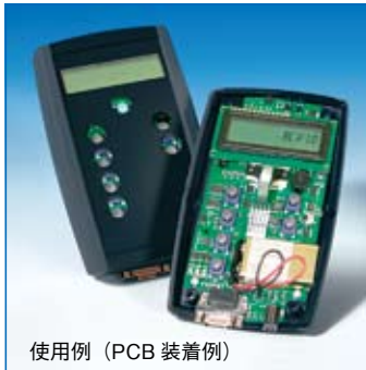
使用例 (PCB 装着例)