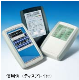
使用例 (ディスプレイ付)